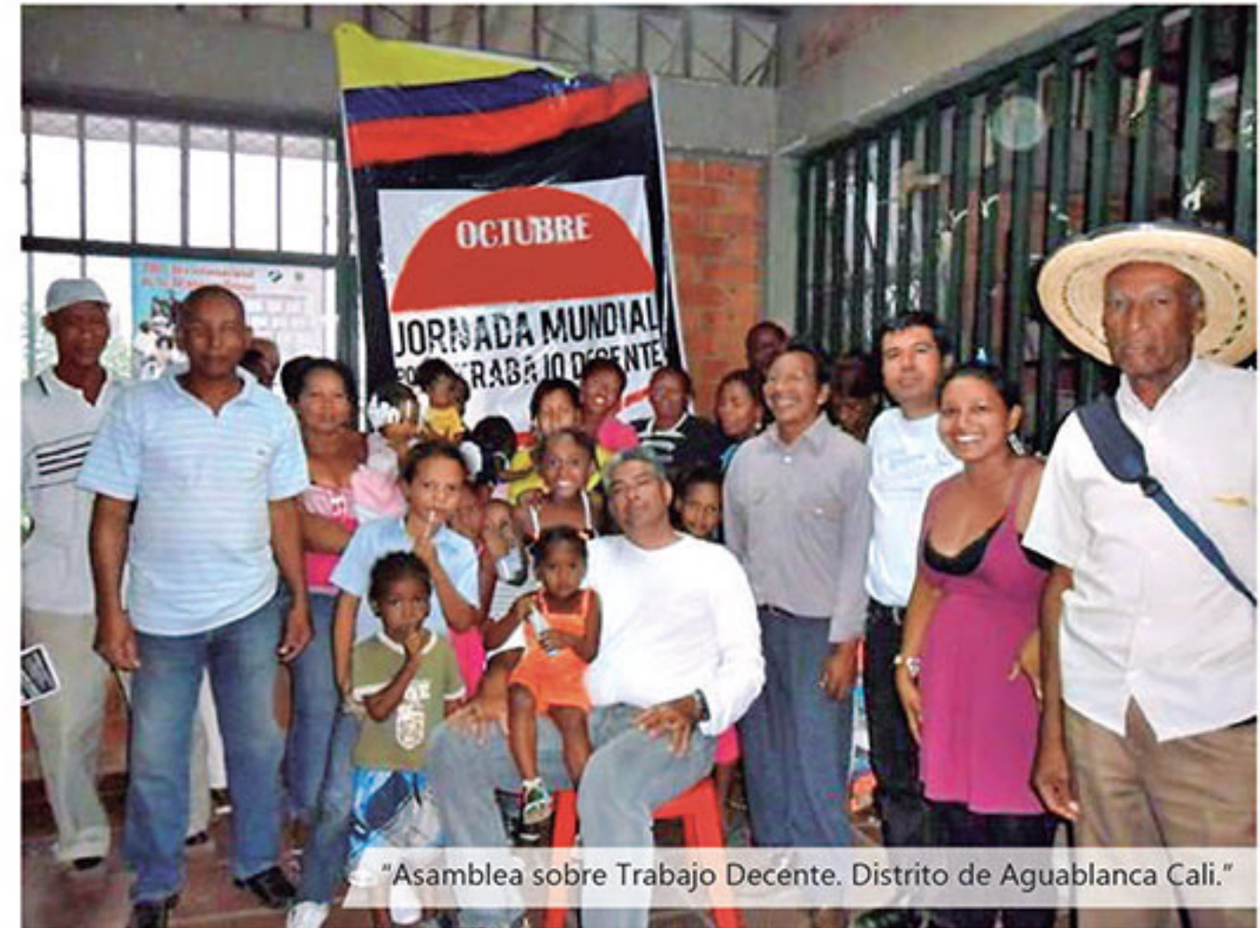
"Asamblea sobre Trabajo Decente. Distrito de Aguablanca Cali."