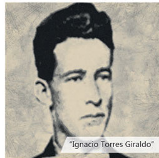
"Ignacio Torres Giraldo"

Las ideas políticas: en este periodo aparecieron en el movimiento obrero colombiano las ideas socialistas, en adición a las ideas liberales y conservadoras ya presentes en las confrontaciones políticas y militares desde la muerte del libertador Simón Bolívar en 1830.